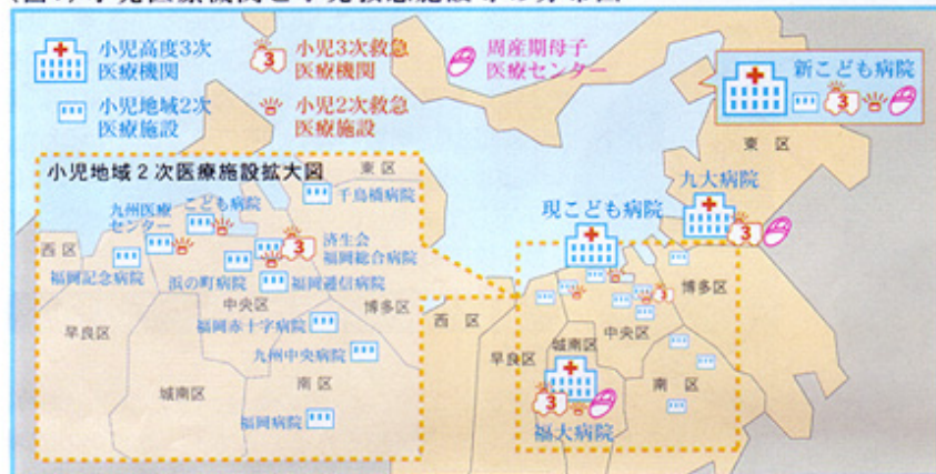
(図1) 小児医療機関と小児救急施設等の分布図