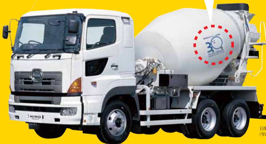
日野 プロフィア・ミキサー車