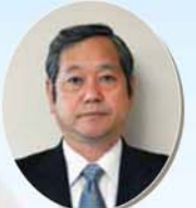
熊本県 副知事 村田 信一