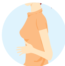
朝のスッキリを ご希望の方に