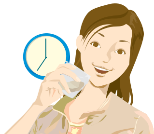
忙しい朝の栄養補給に

ビタミンやミネラルをいくら摂取しても、酵素が足りないと機能させることはできません。 不足しがちな酵素を補って、若々しい身体を保ってください。