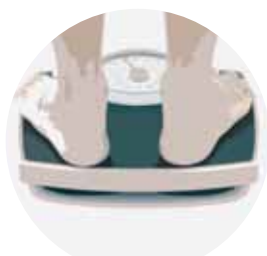
置き換えダイエットを したい方に